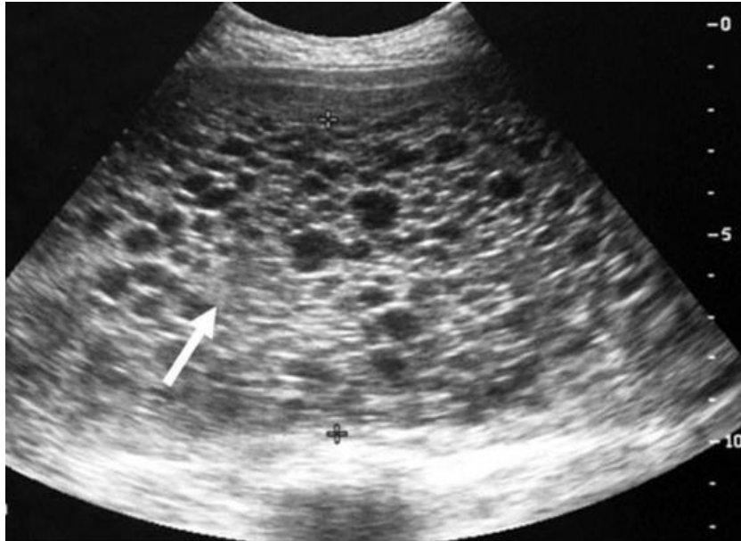
Figura 1: Imagen en tormenta de nieve característica de una enfermedad trofoblástica. Fuente: Historia clínica.