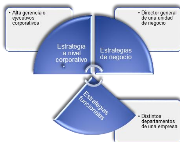
Figura 1. Pirámide de Jerarquías de Estrategias.

Al realizar una selección de una estrategia se debe tomar en consideración los aspectos intrínsecos y del exterior, que no llegue a la afectación de la organización. Es por eso que el líder de las estrategias en la empresa siempre considera su elección de estrategia basándose en el cálculo de la pérdida y ganancia que obtendría la empresa por la estrategia elegida, aunque la decisión es basarse dentro de un análisis racional, con la previsión de una probabilidad con respecto a la teoría de juegos (Picón-Vizhñay, Erazo-Álvarez, & Narváez-Zurita, 2019). Por su parte, para (Koontz & Weihrich, 2013) consideran que la estrategia global de las empresas puede tener niveles jerárquicos, a continuación se detalla en la Figura 1: