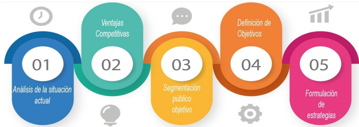
Figura 2. Elementos de la propuesta.