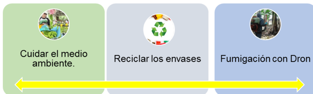
Figura 5. Aspectos de RSE ambiental, reciclar, cambiar de sistemas de trabajo.