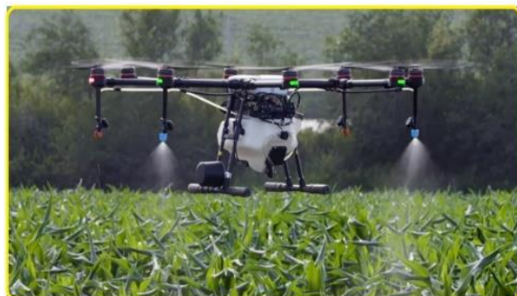
Figura 9. Sistema de atomización focalizada