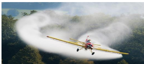
Figura 7. Fotografía de fumigaciones aéreas