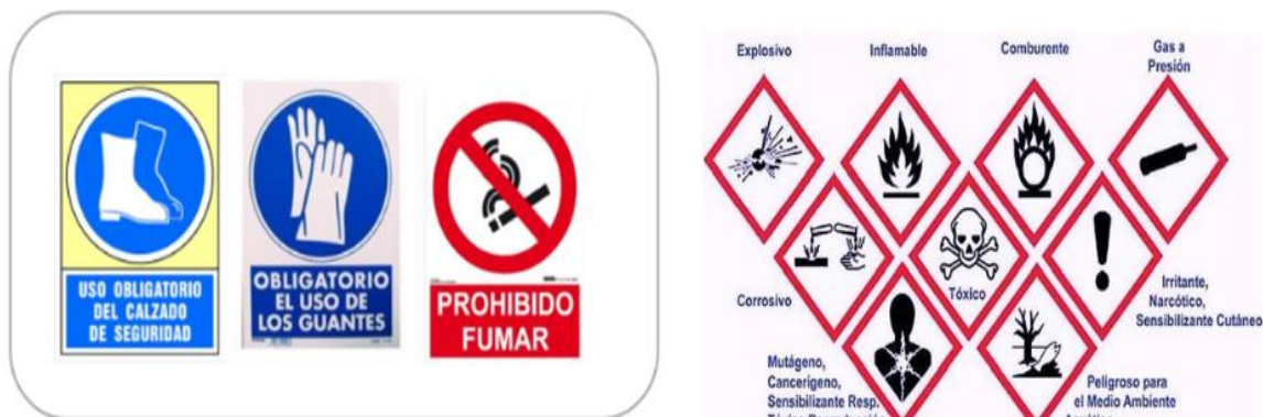
Figura 3. Señalización de prevención

En la figura 3 se presentan las señaléticas respectivas de prevención sobre manipulación de materiales tóxicos y protección al medio ambiente.