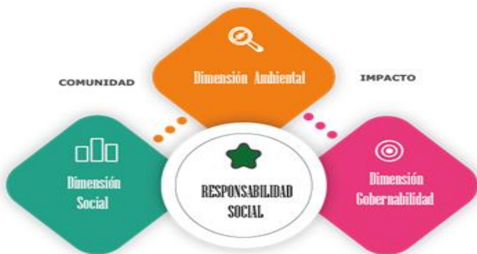
Figura 2. Propuesta de cumplimiento responsabilidad social.

Para dar cumplimiento al objetivo proyectado en este proceso investigativo, como se aprecia en la Figura 2, se propone desarrollar un plan de análisis de responsabilidad social en base al cumplimiento que tienen las empresas destinadas a la industria del camarón, niveles o tipos de certificación internacional, características que destacan su nivel de cumplimiento con el medio ambiente, la comunidad y sus trabajadores.