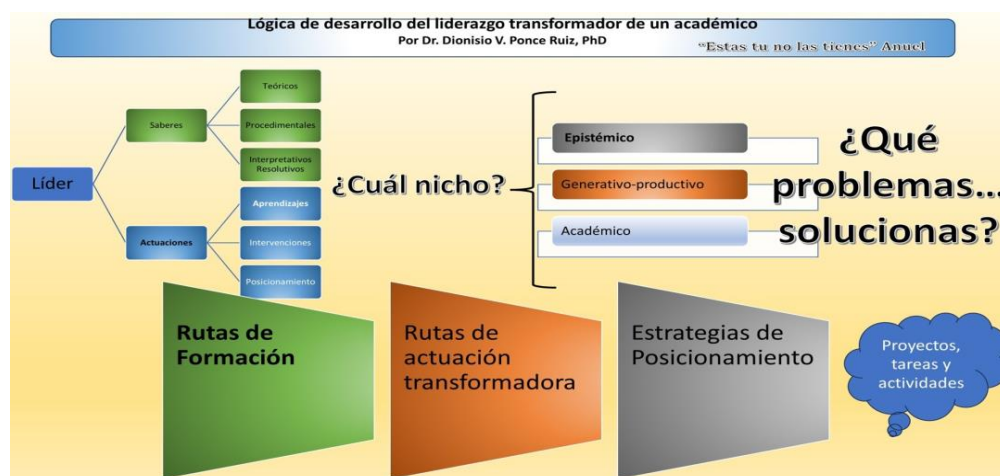
Figura 5. Liderazgo educativo desarrollado en base a la integración de teorías y paradigmas pedagógicos.

universitario (Torres & Rincón, 2024). A continuación, en la figura 5, se describe el modelo propuesto y se procede a presentar el caso de estudio que ha significado su aplicación práctica.