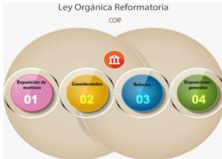
Figura 2. Reforma al Código Orgánico Integral Penal