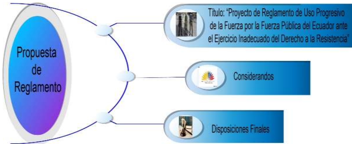
Figura 3. Esquema de las etapas para expedir la propuesta de un Reglamento