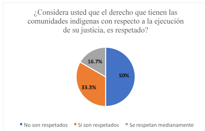
Figura 4. Derechos que tienen las comunidades indígenas.