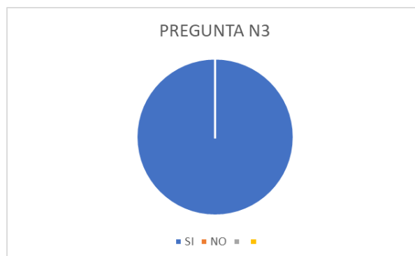
Figura 3. Reparación integral de las víctimas.