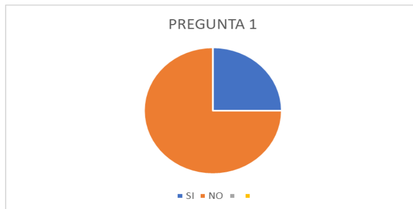
Figura 1. Reparación integral.