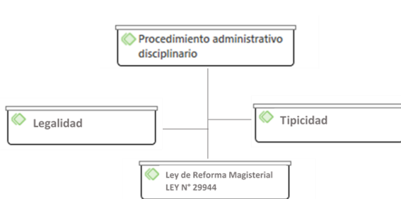
Figura 1. Categoría aplicación del procedimiento administrativo disciplinario. Elaboración: Los autores.